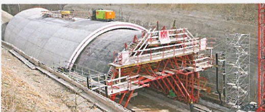
Ausschalen, verfahren, einrichten – mit dem PERI Tunnel-schalwagen benötigt das Baustellenteam dafür nur 1,5 Tage.

Die Herstellung des imposanten Tunnelgewölbes erfolgt in vier Betonierabschnitten, bei denen sukzessive die Außenschalung oben ergänzt wird.