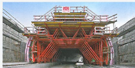
Allein die kranintensiven Bewehrungsarbeiten nehmen bei jedem Takt 4 Tage in Anspruch, danach wird die Außenschalung gestellt und am folgenden Tag betoniert.

Der „Schauinland“ beim Luftkurort Rengsdorf liegt im Naturpark Rhein-Westerwald und bietet weite Ausblicke ins Rheintal und in die Eifel. Durch besondere bauliche Maßnahmen, wie beispielsweise den 170 m langen Landschaftstunnel, wird die neue Umgehungsstraße sorgsam in die Landschaft eingepasst.